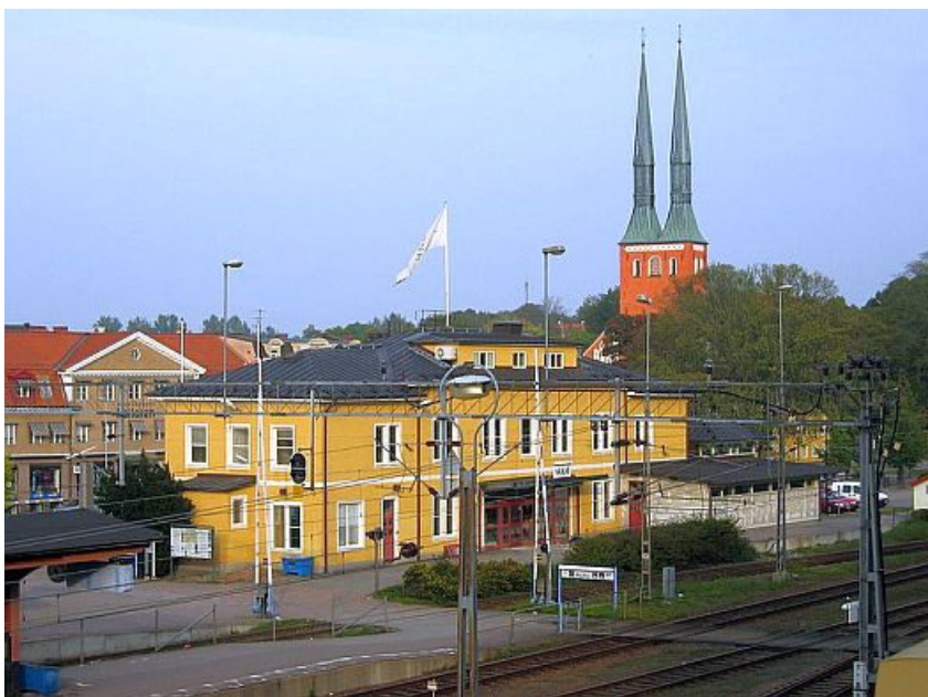
På dette billede ses stationen i Växjö – vist ikke helt nyt billede – med domkirken i baggrunden

Engang skulle jeg tage først flyvebåden til Malmö, så finde et tog på Malmö Centralstation, siden skifte tog måske i både Hässleholm og Alvesta, inden jeg nåede frem til Växjö, en rejse på cirka 4 timer. Nu går det anderledes nemt, idet jeg tager metroen fra Lergravsparken og Öresundstoget fra Kastrup Lufthavns Station. Cirka hver time går der et tog direkte til Kalmar, dvs. jeg kan blive siddende i toget hele vejen fra Kastrup til Växjö.