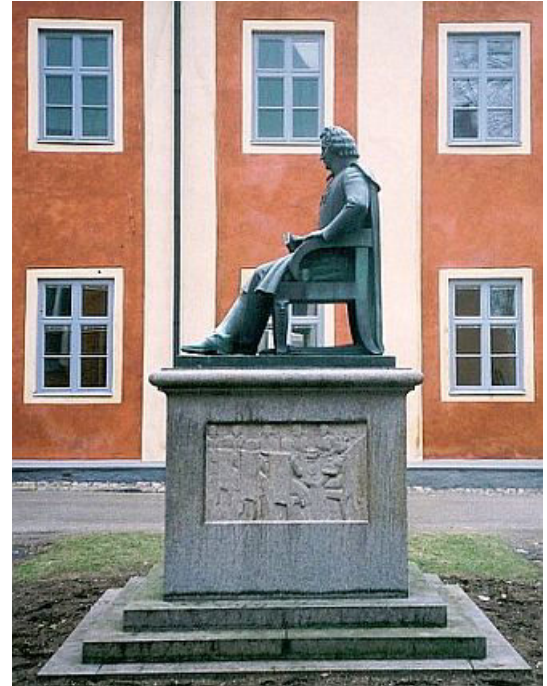
Statue af digteren og biskoppen Esaias Tegnér (1782-1846) ved Karolinerhuset. Tegnér var professor i græsk og blev 1824 biskop i Växjö.