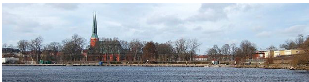
Nedenfor: domkirken set fra Växjö sjö