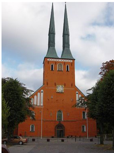
Domkirkens indgang – og alterparti